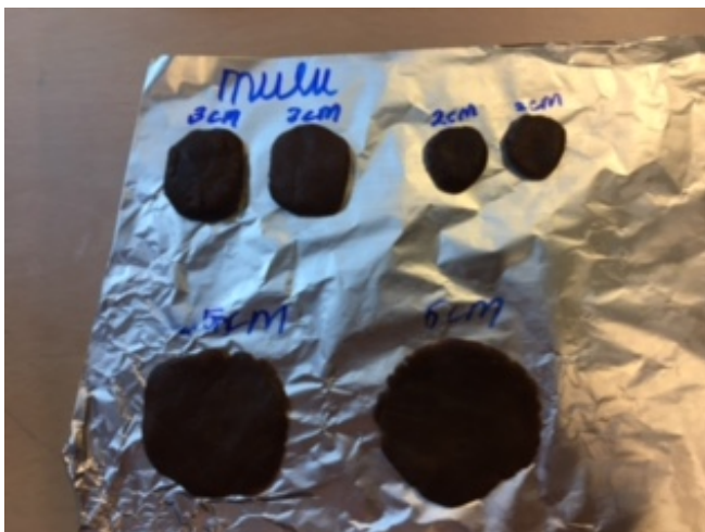
Een rekenles met pepernoten

We zijn ook nog druk geweest met ( aangebrande) pepernoten bakken, de klas ruikt er na het weekend nog naar! Dit hebben we zowel bij de Toppers als de Rekenoppers gedaan. Bij de rekenles moesten de pepernoten een diameter hebben van 1,2,3 en 5 cm en een speciale dikte. Dat was dus precies meten! De kinderen moesten alles zelf doen: 1 persoon was chef en die vertelde wie wat moest doen. Ze moesten zelf het recept lezen, wegen en de oven uitvogelen. De pepernoten zijn met smaak opgepeuzeld. Fijne Sinterklaasviering iedereen alvast! Juf Monique Peters, De Toppers