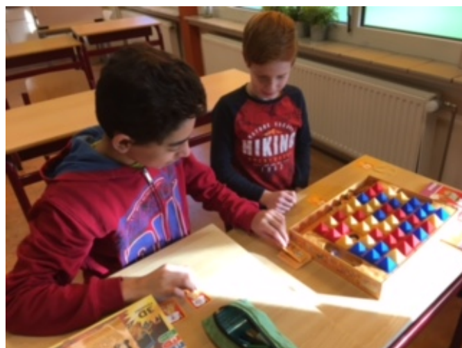
Gezellig samen spelletjes spelen, goed voor de sfeer en leren winnen en verliezen.

We hadden een spelletjesmiddag. De juf had veel spelletjes mee. Zoals monopoly. Alle kinderen hadden het leuk. Het was zo leuk dat we het jammer vonden dat het stopte.